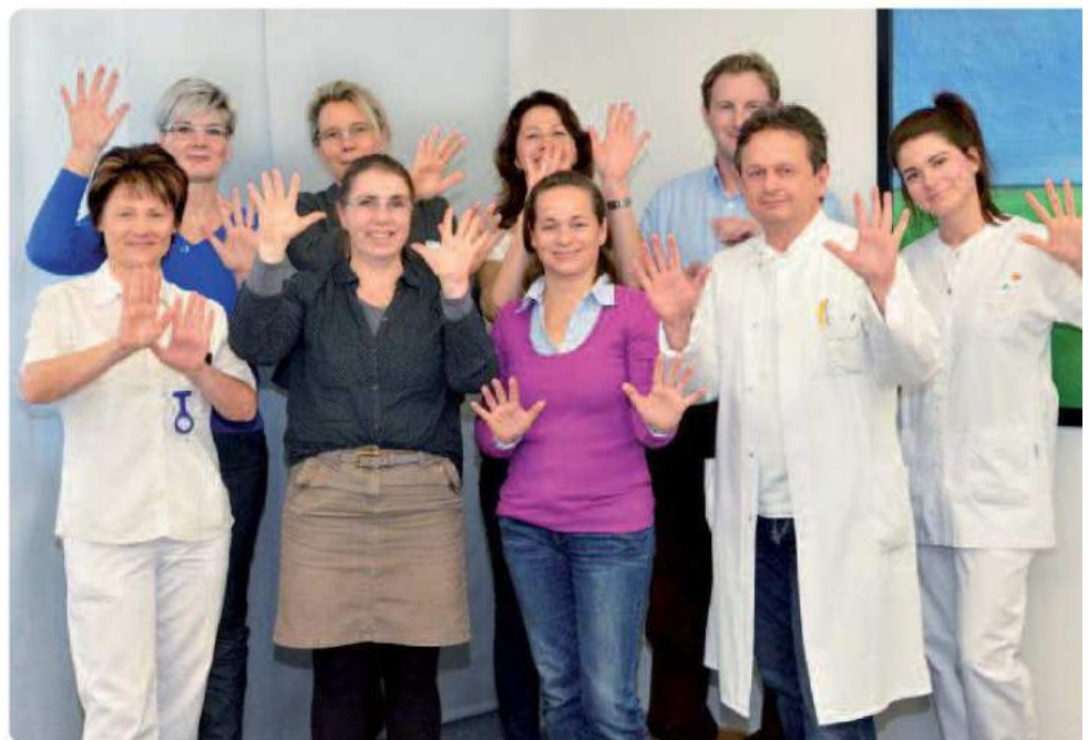
Zeigt her Eure Hände: Die Lenkungsgruppe will die Handhygiene am Carl-Thiem-Klinikum verbessern und für alle selbstverständlich machen.