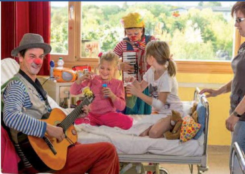
Bevor die Clowns Herr Ferrari und Nono zu den Kindern gehen, informiert sie die Psychologin der Station über die jeweiligen Erkrankungen.

der Cottbuser Kinderklinik und ausgewiesener Kinderonkologe. Er weiß um die schwere Situation für die Kinder, aber auch deren Eltern während der Krebstherapie. Da gibt es nicht nur gute Stunden. Aufzufangen, aufzumuntern, Kraft zu geben und Zuversicht, das ist die Medizin, die kostenlos und doch so viel wert ist wie die bestmögliche Therapie. Die kleinen und großen Patienten der Cottbuser Kinderklinik profitieren davon.