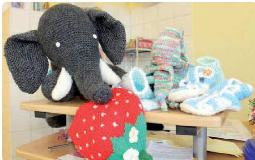
Willkommensgeschenke für neue Erdenbürger.

Familien, die Hilfe brauchen, und Interessierte, die Paten werden wollen, können sich gern an Manuela Zapel wenden. Sie hat ihr Büro im CTK, Haus 45, Ebene 3, Raum 3.228, Tel. 0355 46-21 30.