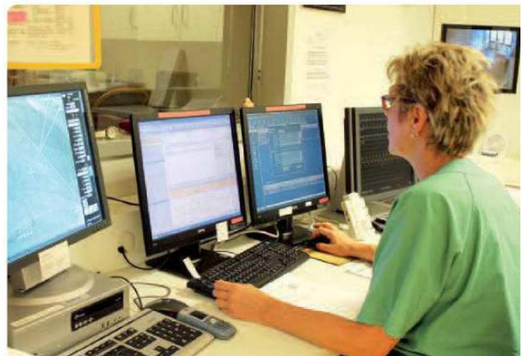
Den Ärzten gleich können Patienten am Bildschirm den Verlauf der Untersuchung verfolgen.