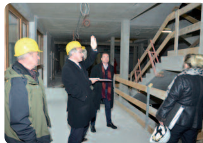
Die Arbeiten gehen gut voran. Die Fotos entstanden im Innenbereich von Haus 62.