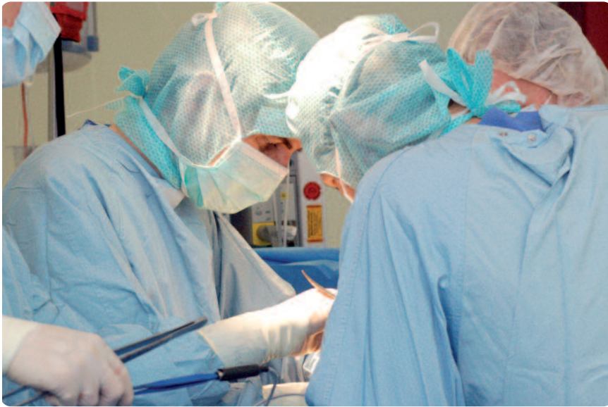
Nach der Diagnose Krebs ist eine Operation oftmals unumgänglich.

Neben den Fachärzten aus dem eigenen Klinikum steht das Onkologische Zentrum auch Medizinern anderer Krankenhäuser der Umgebung sowie niedergelassenen Onkologen offen. Auch sie können an den Tumorkonferenzen teilnehmen und sich aktiv in die einzelnen Phasen der Behandlung – von der Diagnostik über die Therapie bis zur Nachsorge – einbringen.