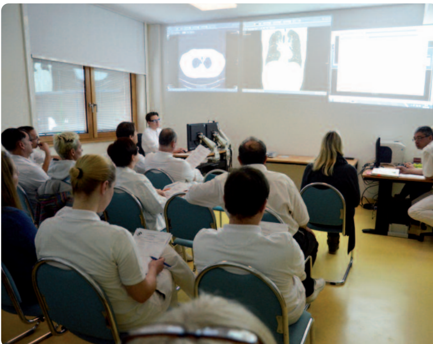
Bei den wöchentlichen Tumorkonferenzen besprechen Fachärzte unterschiedlicher Kliniken Diagnostik und Therapie jedes neuen Patienten.