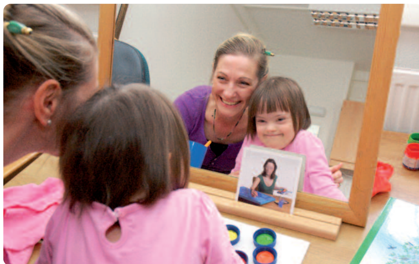
Das Sozialpädiatrische Zentrum, in dem diese Aufnahme entstand, gehört ebenfalls zum Bereich der Fachambulanzen.

Ambulant behandelt werden Patienten darüber hinaus in der Zentralen Notaufnahme, in spezialärztlichen Sprechstunden (z. B. Rheuma) und sogenannten Ermächtigungssprechstunden. Wer letztere anbieten darf, entscheidet die Kassenärztliche Vereinigung (KV) auf Antrag. Je nach Versor-