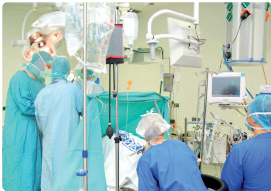
Blick in den OP-Saal: Die Orthopäden des CTK setzen jährlich knapp 750 Hüft- und Kniegelenksendoprothesen ein.

Die Anforderungen an die Zertifikat-Bewerber waren und sind hoch. Die Kliniken müssen eine Mindestanzahl von Endoprothesenimplan-